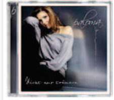
FLEISSIG Nach «Nicht nur träumen» folgt im Sommer 2011 ihr nächstes Album.